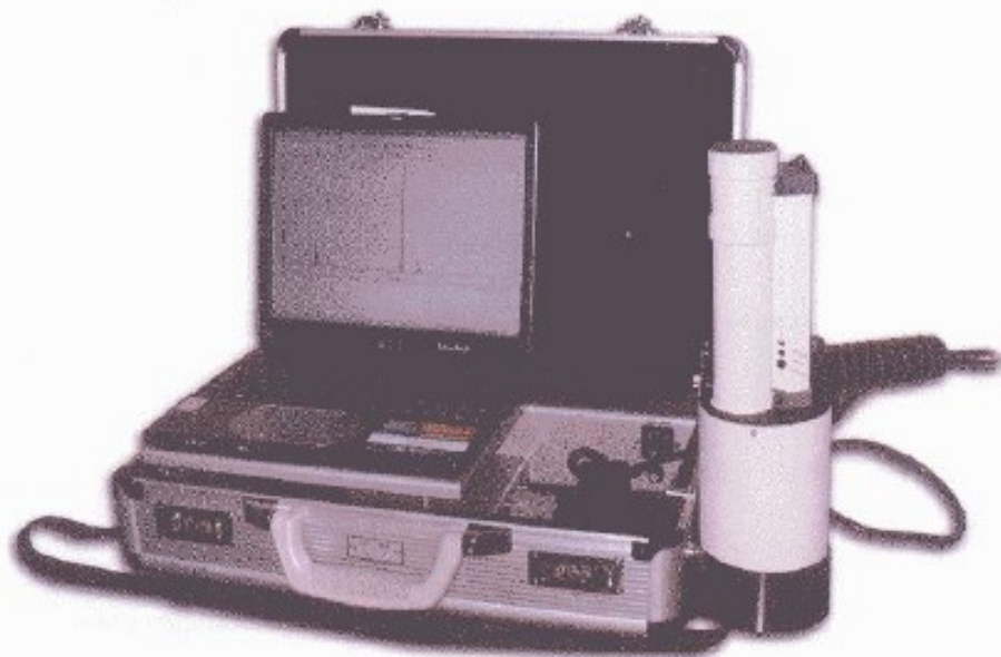
Рисунок 1 - Внешний вид анализатора «Призма» в переносном варианте исполнения